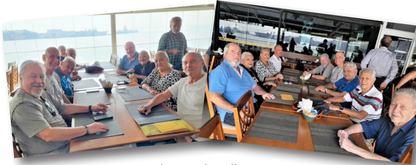
Almoço de Julho - Rio

Aproveite a oportunidade e participe também dos almoços mensais! Os custos são pagos pelos associados, mas a Associação negocia com os restaurantes e consegue ótimos descontos!