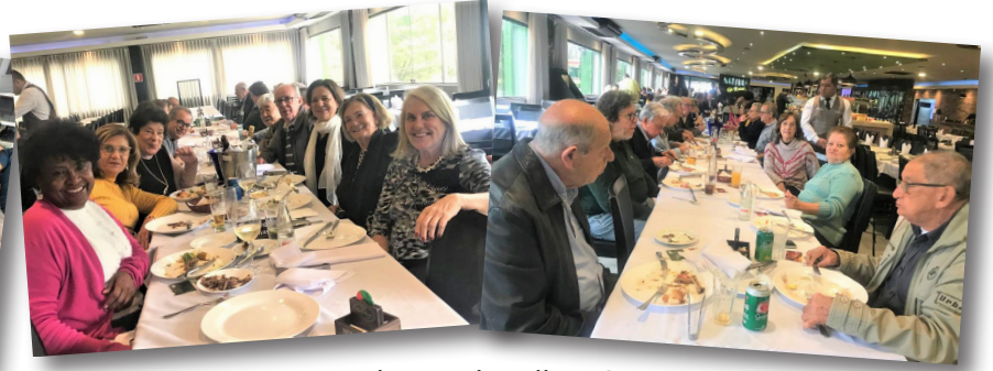
Almoço de Julho - SP