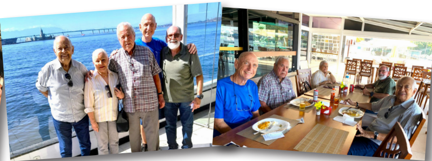
Almoço de setembro - Rio

Como acontece tradicionalmente, neste mês de setembro foram realizados os almoços mensais da Associação, nas bases de SP e Rio. O encontro do Rio de Janeiro se deu no dia 13, no Clube da Aeronáutica e o de São Paulo, no dia 20, na Churrascaria Nativas Grill, na Vila Mariana.