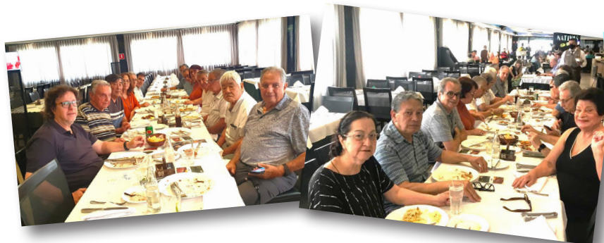
Almoço de setembro - São Paulo